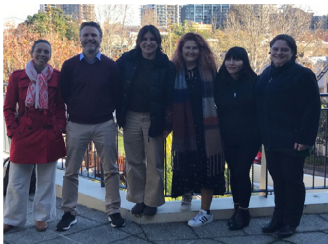
Algunos de los profesores participantes